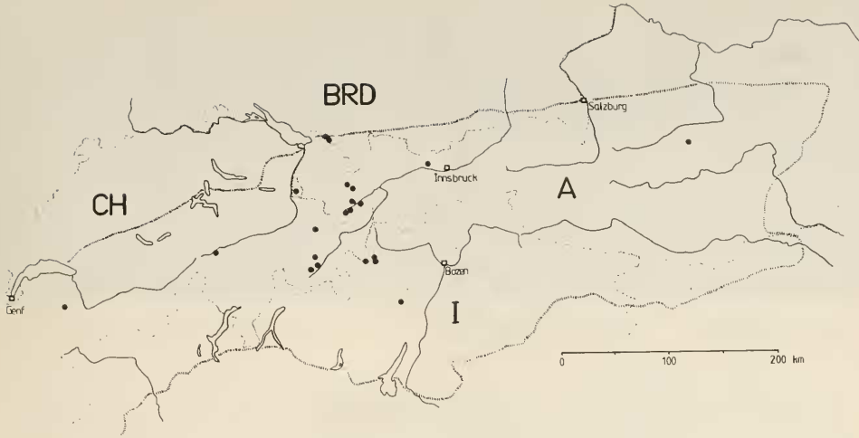
Abb. 1: Fundorte (●) von S. claviventris in den Alpen; zur Orientierung sind das Flußsystem, die Grenzen der Alpenländer und die Abgrenzung des Alpenraumes eingezeichnet (nach Daten von AUBERT et al. 1976: 131, BRUGGE briefl. (coll. Instituut voor Taxonomische Zoölogie, Amsterdam) CLAUSSEN 1987: 342, LINDNER & MANNHEIMS 1956: 124, LUCAS briefl. (coll. LUCAS, Rotterdam), OLDENBERG 1916: 104–5, ROHLFIEN & EWALD 1975: 157, SZILÁDY 1938: 140–1; STROBL 1910: 104–5).

25. 6.–27. 8. mit Maximum Mitte Juli an ( n = 24 ), GOELDIN (1974: 160) fand die Art ebenfalls in der Westschweiz zwischen dem 16. 5. und dem 15. 7. Das Typus-Exemplar fing STROBL (1910: 104–5) Ende Mai in der Steiermark. Die Höhenverbreitung weist S. claviventris als echtes Gebirgstier aus, das zwischen 980 m und 2700 m über NN angetroffen werden kann. Bevorzugt wird die subalpine und alpine Höhenstufe zwischen 1800 m und 2400 m. Hier ist die Art besonders an feuchten Stellen in Wiesen-, Rasen- und Hochstaudengesellschaften zu finden (s. o., CLAUSSEN l. c.).